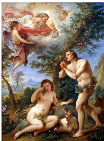
Hegedűs Endre: Édenkert (1943) és Charles Joseph Natoire: Kiűzetés a Paradicsomból (1740)

Egyéni, de például várható: idill, béke, önfeledtség, jólét, gondtalanság, lázadás, bűn, tilalom, tilalomszegés, harag, veszteség, büntetés, stb.