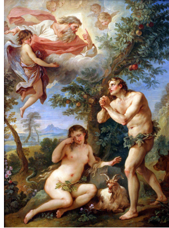
Hegedűs Endre: Édenkert (1943) és Charles Joseph Natoire: Kiűzetés a Paradicsomból (1740)