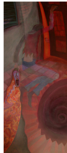
Ferenczy Károly: A tékozló fiú (1892) és Ilyés Márta: A tékozló fiú hazatérése (2000) című képe