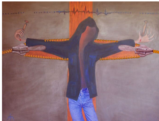
Ilyés Márta: A harmadik lator , 2006